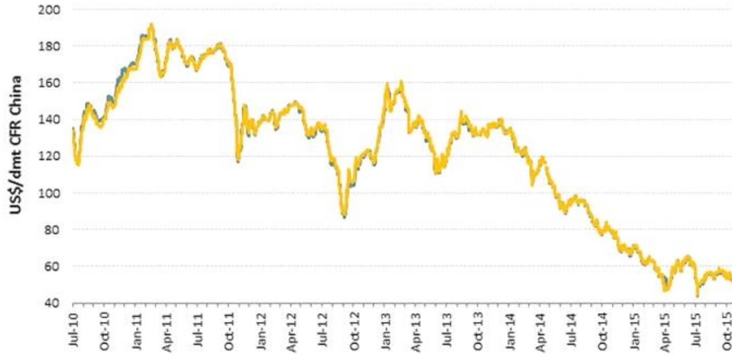
روند تغییرات ۵ ساله بهای سنگ آهن در بازارهای جهانی